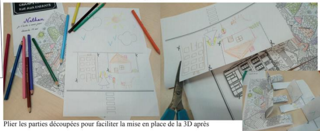
Plier les parties découpées pour faciliter la mise en place de la 3D après